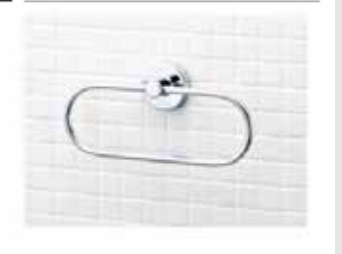
スタンダードシリーズ タオルリング KF-91A