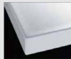
H プレーンホワイト