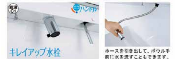
キレイアップ水栓

上から水が出るキレイアップ水栓は、水栓まわりに水がたまらないのでお掃除簡単です。