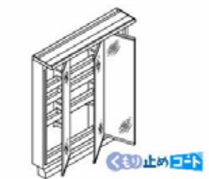
3面鏡(全収納・スリムLED) MVJ1-753TXJU