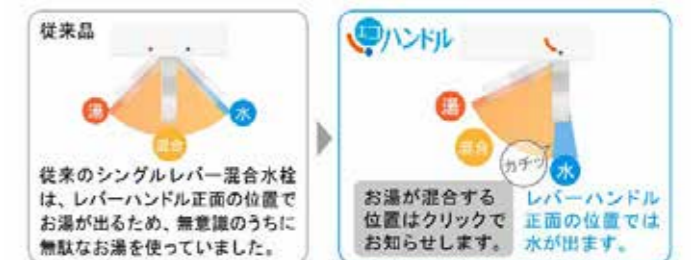
従来のシングルレバー混合水栓は、レバーハンドル正面の位置でお湯が出るため、無意識のうちに無駄なお湯を使っていました。