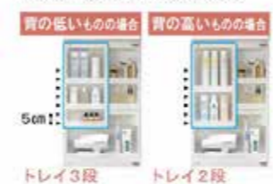
トレイ3段 / トレイ2段