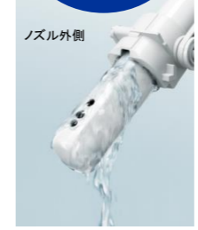
※詳細はカタログ参照ください