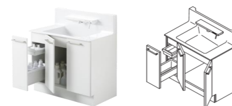
片引き出しタイプ(間口900mm)