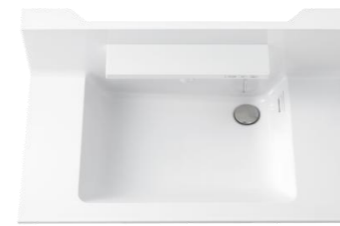
ボウル一体カウンター(実容量12L)