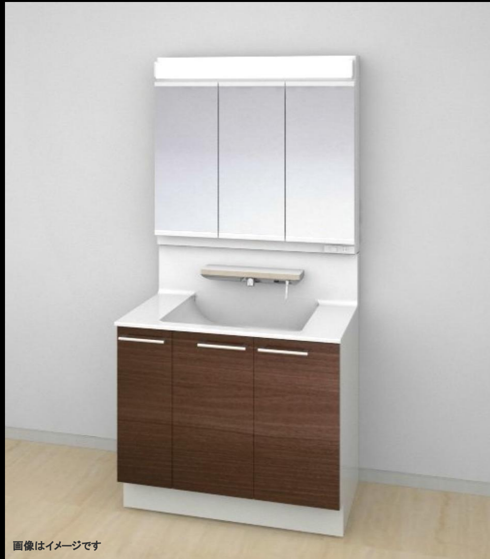
画像はイメージです