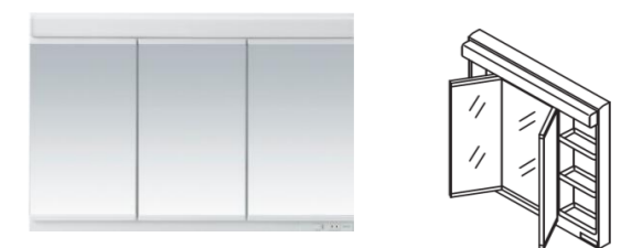
三面鏡(ペーシックLED・間口900mm)